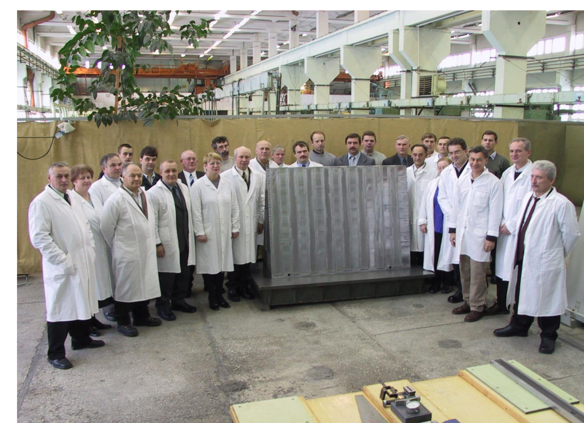
Сотрудники ИТЭФ, ВНИИТФ и CERN у первого модуля переднего адронного калориметра во ВНИИТФ